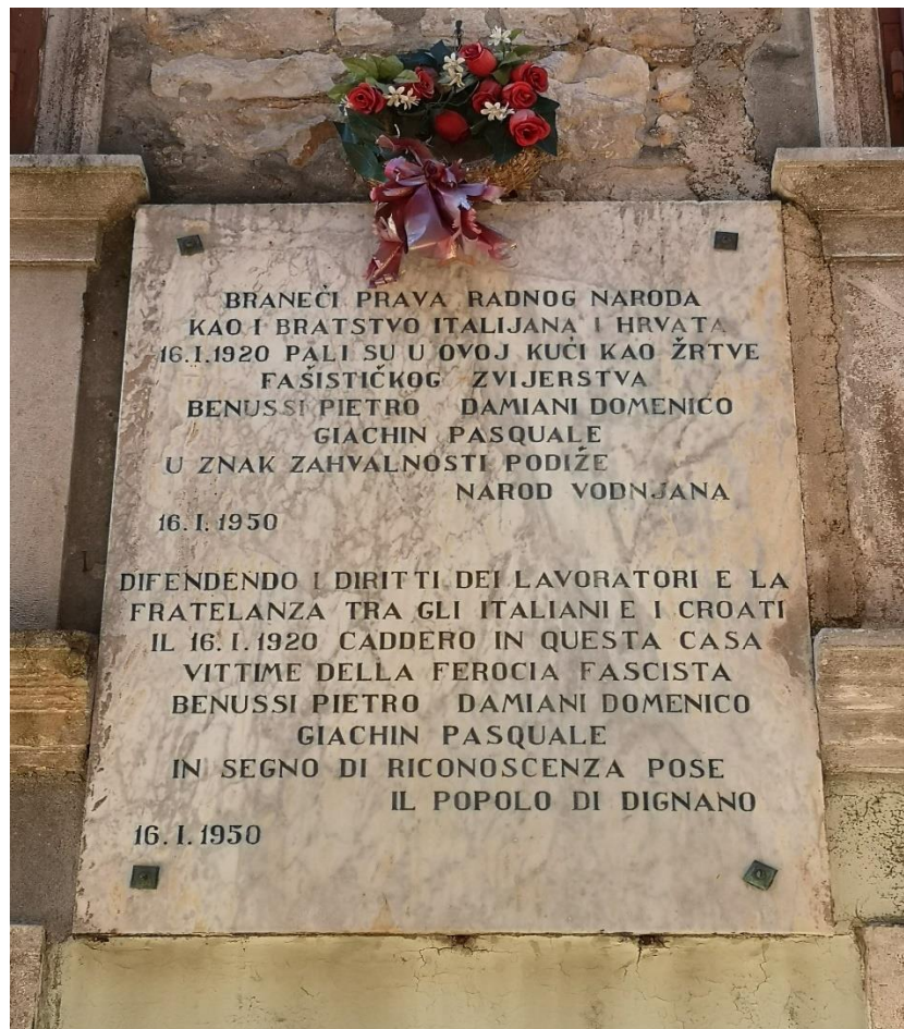
Spomen-ploča stradalim Vodnjancima u Vodnjanskoj bitci, 16. I. 1920