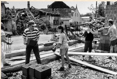
Volonterski projekt Pakrac.

Tijekom 1993. članovi ARK-a osnovali su Volonterski projekt u Pakracu, u Hrvatskoj. U sklopu projekta, nacionalne i međunarodne grupe volontera nudili su neposrednu pomoć zajednicama pogođenim ratom. Obnavljali su im kuće, organizirali su dijaloge i okupljanja kako bi potaknuli na obnovu i pomirenje, pomagali su izbjeglicama, itd.