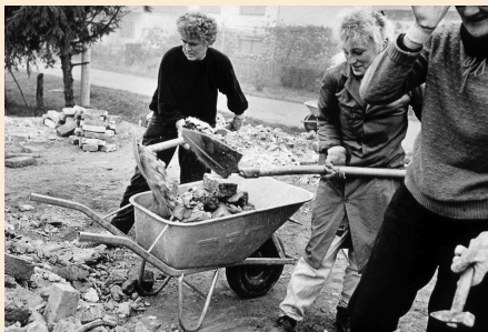
Volunteer project Pakrac.