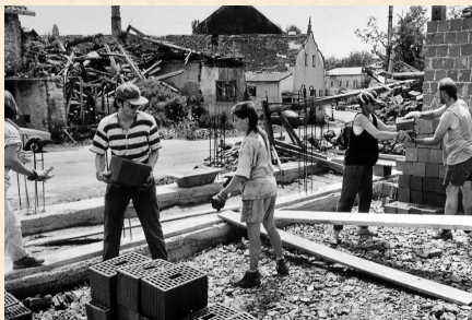
Volunteer project Pakrac.

In 1993, ARK's members founded the Volunteer project, in the city of Pakrac, Croatia. Through the project, national and international groups of volunteers offered immediate help to communities affected by the war, by rebuilding houses, organizing dialogues and gatherings to support rebuilding and reconciliation, and helping refugees.