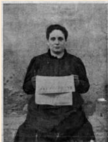
Fotografia de Teresa Claramunt (1862-1931)

Teresa Claramunt, una de les referents de l'anarcofeminisme, va dir en un dels seus mítings: "Ni obreras explotadas en las fábricas ni esclavas en el hogar o la familia: Por una sociedad sin amos ni señores, comunista y libertaria, de hombres y mujeres libres!".