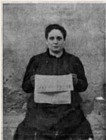
Photography of Teresa Claramunt (1862-1931)

Teresa Claramunt, one of the leaders of the anarcho-feminism movement said in one of her meetings: "Neither exploited workers in the factories nor slaves in the home or the family: For a libertarian communist society without masters or lords, of men and free women!"