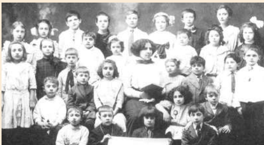
Fotografia d'un grup de l'Escola Moderna