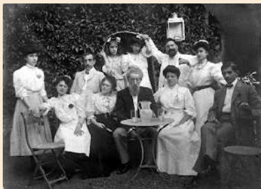
Família burgesa estiuant a Montcada i Reixac. Any 1910.

La casa, tal com porten defensant autores feministes des de fa dècades, és també un espai de poder, jerarquia i reproducció dels rols socials d'opressió. Si ens centrem a les cases burgeses i obreres de la Barcelona de principis del s. XX, veiem un seguit de rols superposats que definien la posició social de cada un dels seus individus. A les famílies burgeses l'home era la figura principal, seguit dels seus fills i hereus, posteriorment les dones segons edat, els infants i finalment el servei domèstic. A les famílies obreres, també l'home era l'individu amb més poder, que treballava en una fàbrica o taller fora de casa, i la dona, que sovint treballava a casa i en una fàbrica, i els infants quedaven en segon terme.