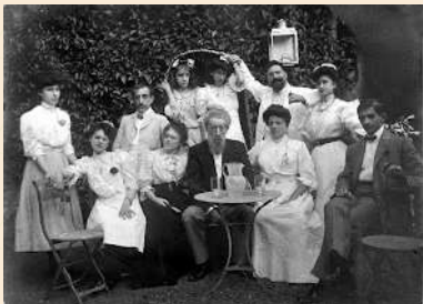
Bourgeois family vacationing in Montcada i Reixac (Catalunya). Year 1910.

In bourgeois families the man was the main figure, followed by his male children and heirs, then the women depending on their age, the children and at the bottom the domestic service. In working-class families, the man was also the member with most power, who worked in a factory or workshop outside the home, and the woman, who used to work at home and in a factory and the children after.