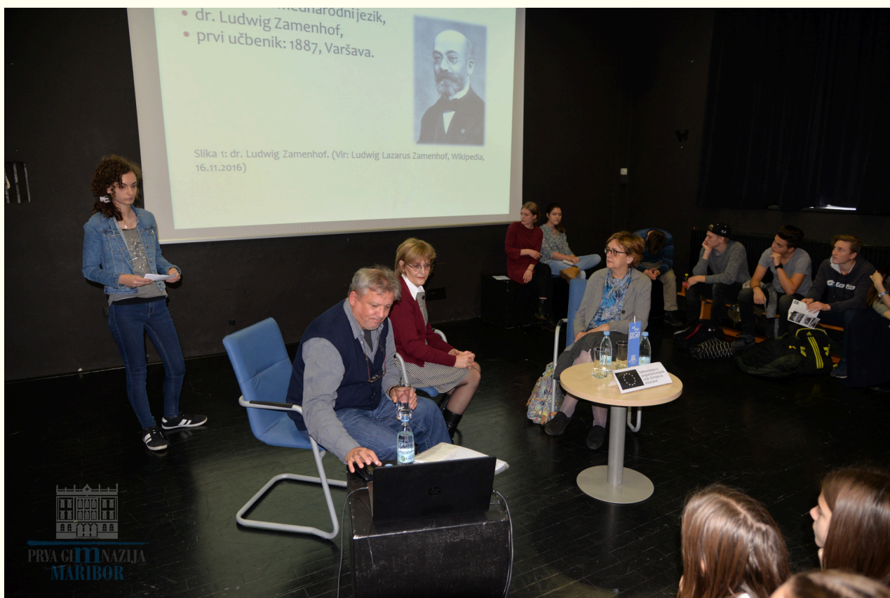
Pogovor s Hertinima hčerkama Cvetano Krstev Vitas in Srmeno Krstev, Prva gimnazija Maribor, 18. november 2016